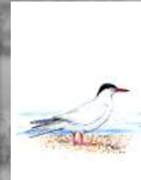
golondrina de mar golondrina de mar Thalaseus sandvicensis