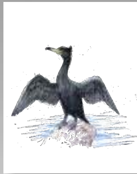
corvo mariño cristado cormorán moñudo Phalacrocorax aristotelis