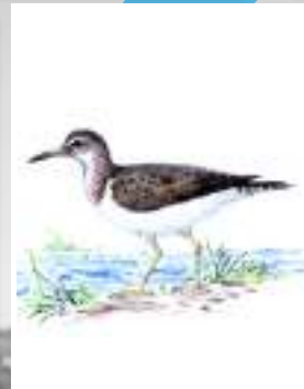
bilurico das rochas andaríos chico Actitis hypoleucos