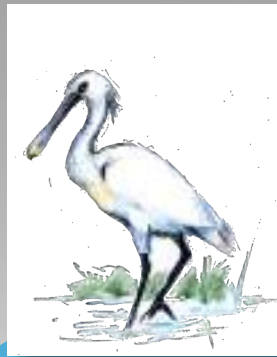
espátula común espátula común Platalea leucorodia