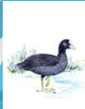
galiñola negra focha común Fulica atra