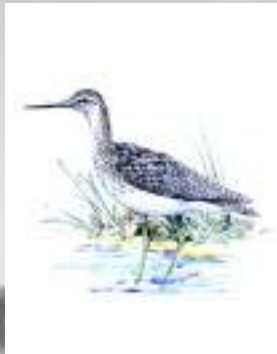
bilurico común archibebe común Tringa totanus