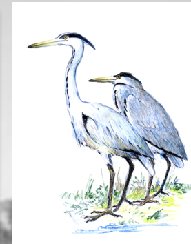
garza real garza real Ardea cinerea