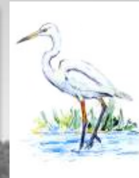
garzota común garceta común Egretta garzetta