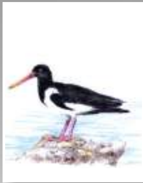
gavita ostrero euroasiático Haematopus ostralegus