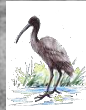
mazarico chiador zarapito trinador Numenius phaeopus